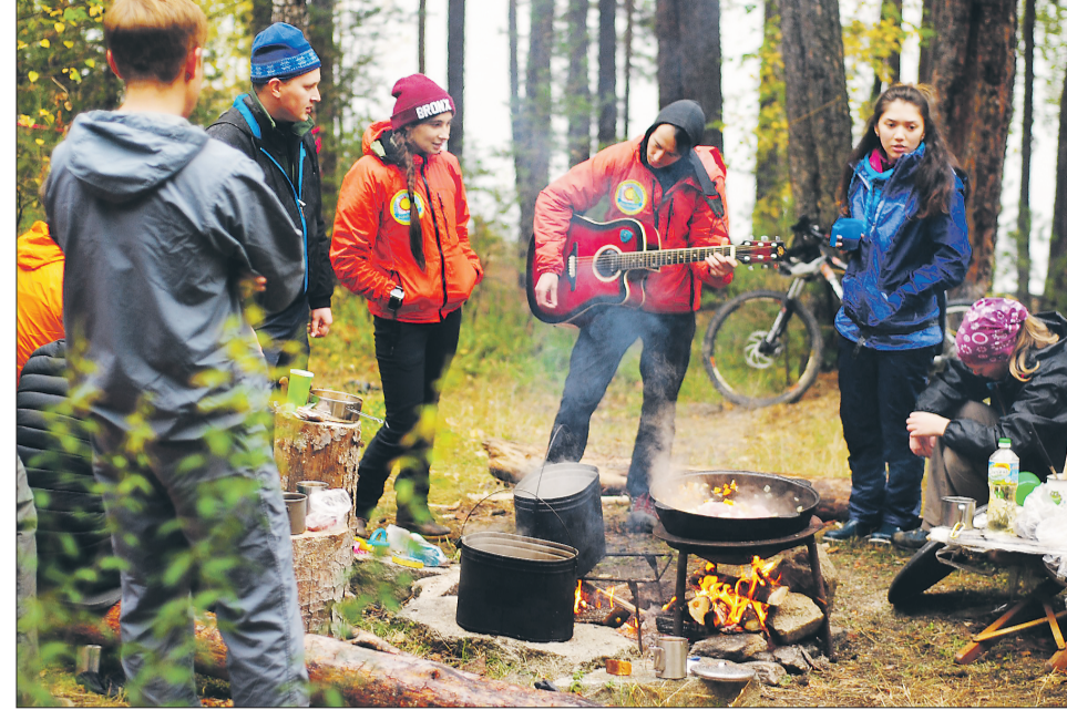
Туризм – хорошая возможность отдохнуть от городской суеты и насладиться природой. Неважно, что вы выберете – пеший поход, сплав по реке или что-то другое, главное, чтобы с вами были хорошая компания и отличное настроение

Вещи лучше складывать в пакеты: даже если начнётся дождь, они останутся