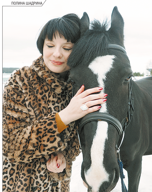
Маяковский посвятил лошадям целое стихотворение. Он писал: «Лошадь, слушайте – чего вы думаете, что вы сих плоше? Деточка, все мы немножко лошади, каждый из нас по-своему лошадь»