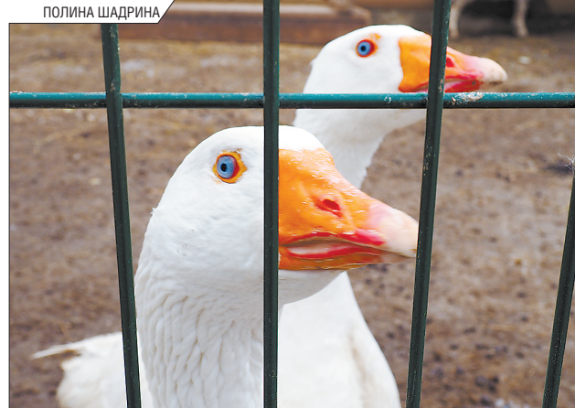
Страшилки о том, что гуси больно щипаются, небезосновательны, поэтому с этими птицами стоит быть осторожнее