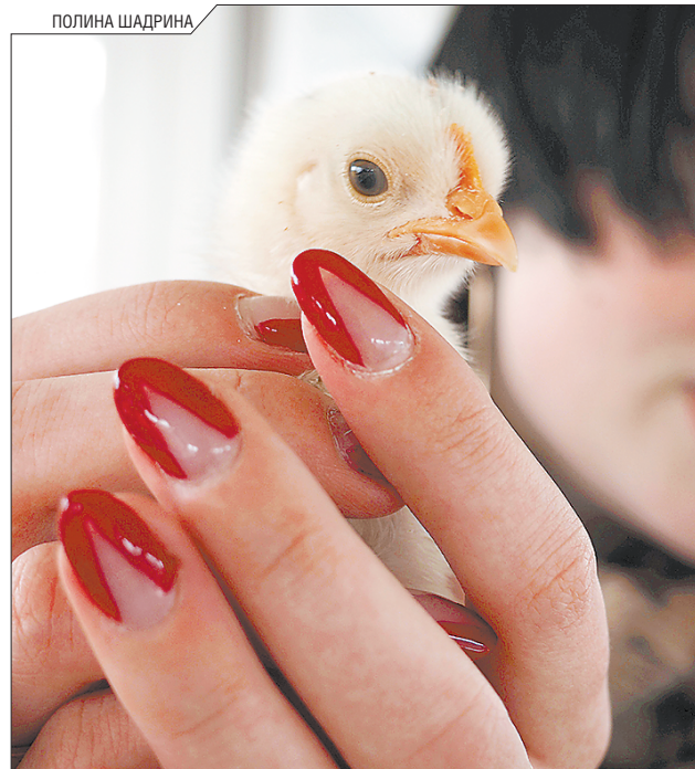
Если хочется узнать о животных больше, можно отправиться в контактный зоопарк. Вот с таким малышом познакомилась «СверхНовая Эра» во время поездке

Во время подготовки этого номера наша редакция поняла: интереснее, чем писать о животных, может быть только наблюдать за ними. Поэтому мы отправились в один из загородных клубов неподалёку от Екатеринбурга. Представляем фототчёт