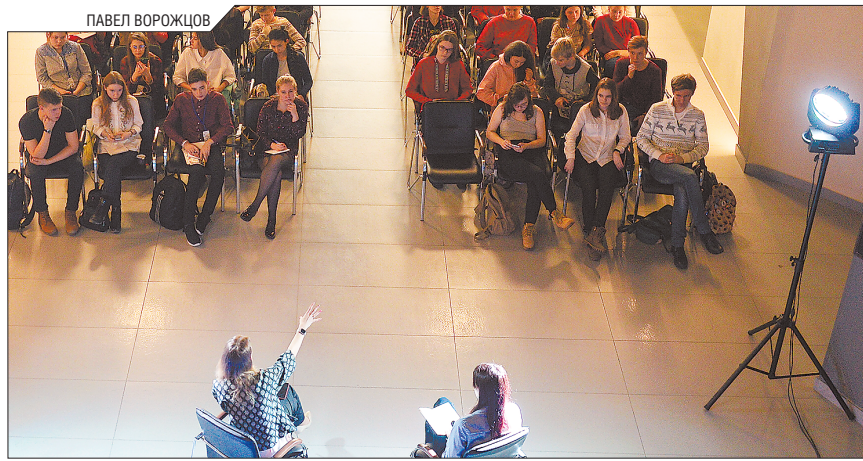
Журналисты «Областной газеты» на конкретных примерах объяснили участникам, как нужно работать с текстами

– Собственное мнение имеет место в журналистике, но не в медиа, последние направлены либо на пиар, либо на простое отображение новостей такими,