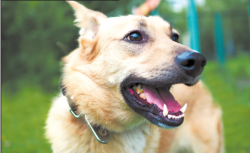
Красавица Соня, с которой гуляла наш корреспондент, всё ещё ждёт своих будущих хозяев. Кстати, прошлой весной она заняла третье место в конкурсе «Самый громкий лай», так что вы с ней точно не соскучитесь

рез забор приюта, а после она перенесла операцию по удалению кисты на голове. Тем не менее она и другие собаки с радостью идут на контакт, их можно угощать лакомствами, пробовать обучать командам.