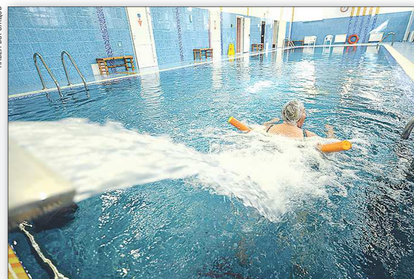
Занятия в лечебном бассейне позволяют ускорить темпы реабилитации больных с параличами и парезами

природными факторами подняли на новый уровень оказание медицинской помощи кардиологическим и неврологическим группам больных. Принцип индивидуального подхода к пациенту и кропотливая работа специалистов гарантируют высокие результаты лечения и повышают качество жизни. — Мы взяли за пример немецкую модель реабилитации, которая основывается на том, что пациент должен оказаться в гармоничной обстановке, где у него должны быть хорошие бытовые условия, полноценное питание, качественное медикаментозное лечение, где ему будет предоставлен