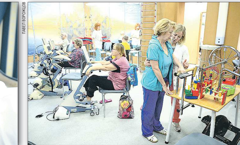
Специалисты клиники проводят занятия на реабилитационных тренажёрах, для каждого больного подбирается своя программа реабилитации

В советское время на территории посёлка Чусовское озеро располагался противотуберкулёзный диспансер, который прекратил своё существование в 1987 году, здание больницы на берегу этого прекрасного озера стояло без присмотра и разрушалось. Наступили 90-е годы, время разрушений и созиданий, время появления этого центра. Идея проведения ранней медицинской реабилитации пациентам после сосудистых катастроф уже давно превратилась в осознанную необходимость, а проведённый глубокий анализ ситуации в здравоохранении выявил острую потребность в реабилитации пациентов после перенесённого нарушения мозгового кровообращения разной степени тяжести. — В 1994 году меня утвердили на должность главного врача будущего центра. Моими коллегами и мной было разработано и предложено решение задачи по созданию новой модели ранней медицинской реабилитации боль-