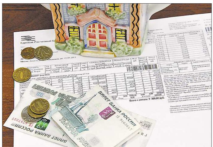
Благодаря нововведениям потребители услуг ЖКХ смогут сэкономить

Нижнетагильский автовокзал связывает город более чем со 160 населёнными пунктами Свердловской области и другими субъектами РФ. В год через этот транспортный узел проходит миллион человек. Ежедневно от автовокзала отправляются автобусы по 63 маршрутам. В 2017 году здание автовокзала открылось после капитального ремонта: в помещениях установили систему кондиционирования, обновили кровлю здания, утеплили фасад. На прилегающей территории заасфальтировали парковку и разворотную площадку, обустроили 10 крытых перронов.