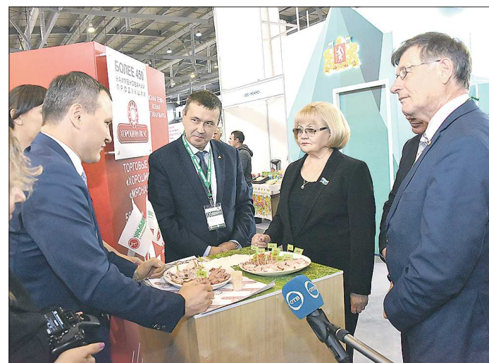
Посетители выставки по достоинству оценили новую продукцию пищевого комбината «Хороший вкус»

Остальные 20 процентов свинины поступают на пи-