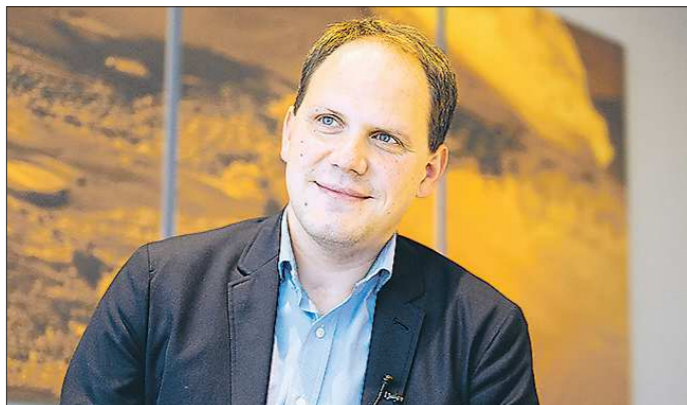
ПРЕЗИДЕНТСКИЙ ЦЕНТР «ВЕЛИКИЙ»