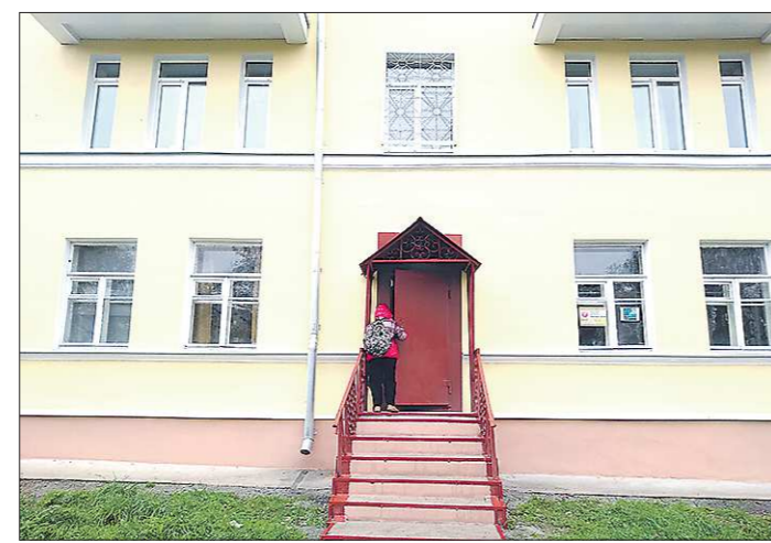
Капремонт подарил дому новую жизнь