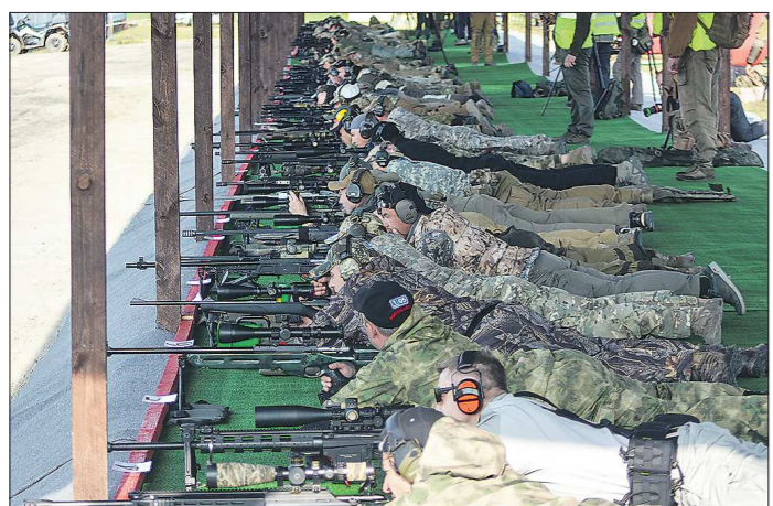
Самая распространённая позиция снайперов — положение с упором лёжа. Но это только одно из 30 стрелковых упражнений