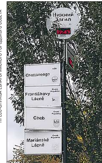
В верстовом столбе, показывающем время в городах-побратимах Нижнего Тагила, таблички с Кривым Рогом уже нет, а с Евпаторией – ещё нет

Главы городов-побратимов обязательно встречались