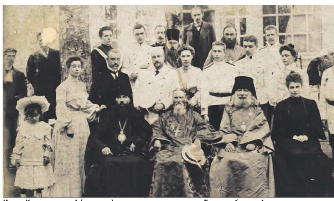
Иоанн Кронштадтский (в центре) в окружении духовенства Екатеринбургской епархии и первых лиц города в июне 1905 года