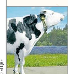
Тагилу — единственному быку-производителю породы — сейчас 7 лет

Тагильская порода была выведена на Среднем Урале в конце XVIII века путём скрещивания местных коров и быков-производителей из Европы, которых сюда привезли Демидовы. В XIX веке порода получила широкое распространение на всём Урале, а к середине 70-х годов XX столетия поголовье «тагилок» достигло 700 тысяч коров. Но в 90-е годы оно резко сократилось — уралочка не выдержала конкуренцию с коровами зарубежных пород, которые давали значительно больше молока. Сейчас во всей России осталось не более 100 коров тагильской породы и один бык-производитель по кличке Тагил, который живёт в Головановском центре по воспроизводству сельскохозяйственных животных в Московской области. В нашей области коров тагильской породы больше нет.