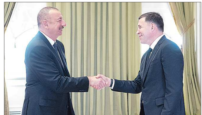
Евгений Куйвашев в своём Instagram сообщил, что пригласил Ильхама Алиева в Екатеринбург на празднование 75-летия Победы и для участия в мероприятиях Универсиады

— По итогам прошлого года наш товарооборот увеличился до 95 миллионов долларов, и это не предел. У меня есть чёткое понимание, что в этом году мы превысим показатель