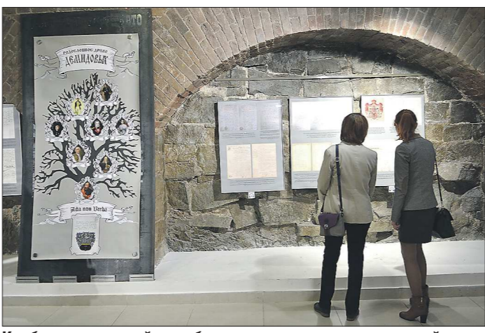
К юбилею архивной службы в музее архитектуры и дизайна УрГАХУ открылась архивная выставка о династии Демидовых в Европе

Историки убеждены, что этот облик старого Урала надо сохранить для потомков. Определение границ охранной зоны памятников закрепляет в законе запрет на их нарушение.