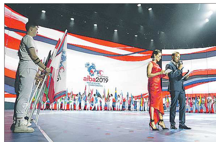
Парад флагов стран-участниц чемпионата мира по боксу в Екатеринбурге

Также 14 сентября зрители смогут увидеть в деле ка-