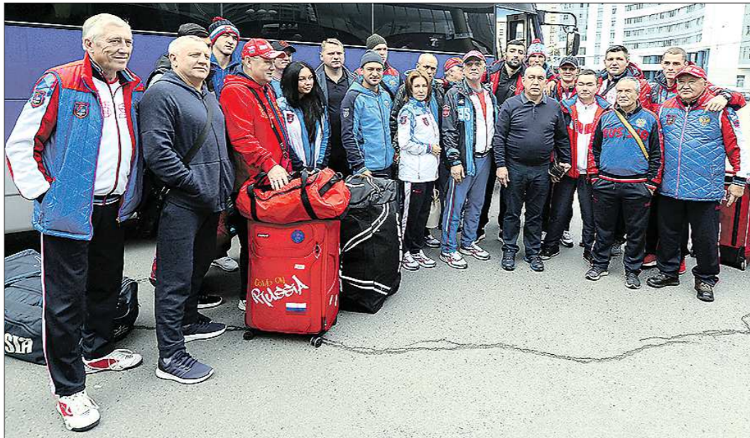
Сборная России по боксу в полном составе прибыла в Екатеринбург на чемпионат мира

У бокса в России большие традиции, сомнений в победе российской заявки не было. Нами проведена хорошая работа. Нет сомнений, что турнир в Сочи пройдёт на самом высоком уровне, – от-