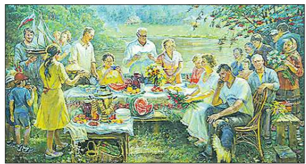
Н. КОСТИНА. КАРТА ИЗ ФИЛЬМА «ОДЕССА». РЕЖ. В. ТОДОРОВСКИЙ. МОСКВА