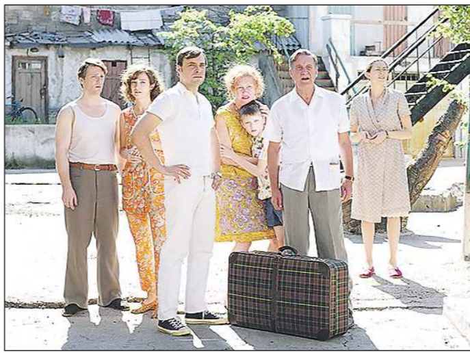
Фильм Тодоровского, уввы, по разным причинам снять в Одессе не получилось. Натуру пришлось искать в других местах