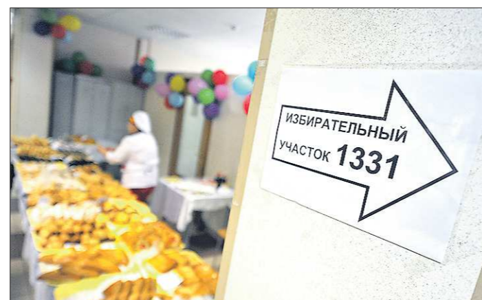
Голосование избирателей 8 сентября 2019 года состоится на территории 511 избирательных участков

Как ранее писала «Областная», в грядущей избирательной кампании федерально-го масштаба планируется применить инновационный подход к выборам с использованием цифровых избирательных участков. На территории Москвы создали 30 таких участ-