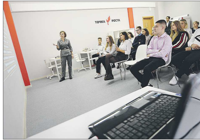
Кабинеты «Точки роста» в школе ещё не открыты официально и не оборудованы до конца. Но для старшеклассников там уже провели первый профориентационный классный час

– В нашей области есть такие перспективные образовательные центры, как кванториумы, но они доступны не для всех детей. Центры же «Точки роста» – по большому счёту, как мини-квантори-