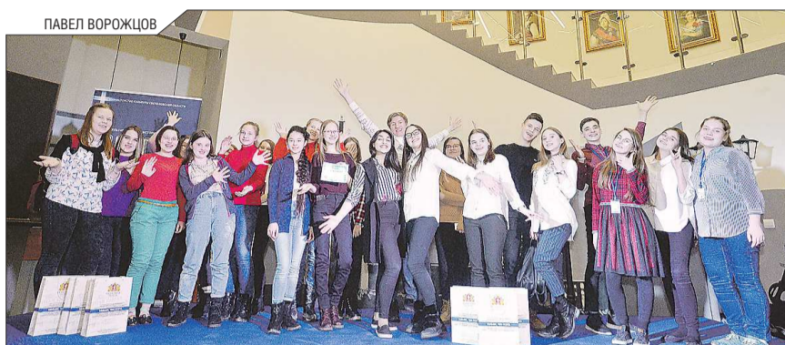
Одна из главных целей «СверхНового взгляда» – дать юнкорам возможность познакомиться и обмениваться идеями

«Областная газета» и «СверхНовая Эра» вновь наградят лучших авторов