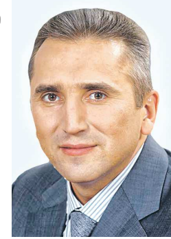
Александр МООР, губернатор Тюменской области

(На рабочем совещании в рамках туристического форсайт-форума «Сибирь – 30 лет»)