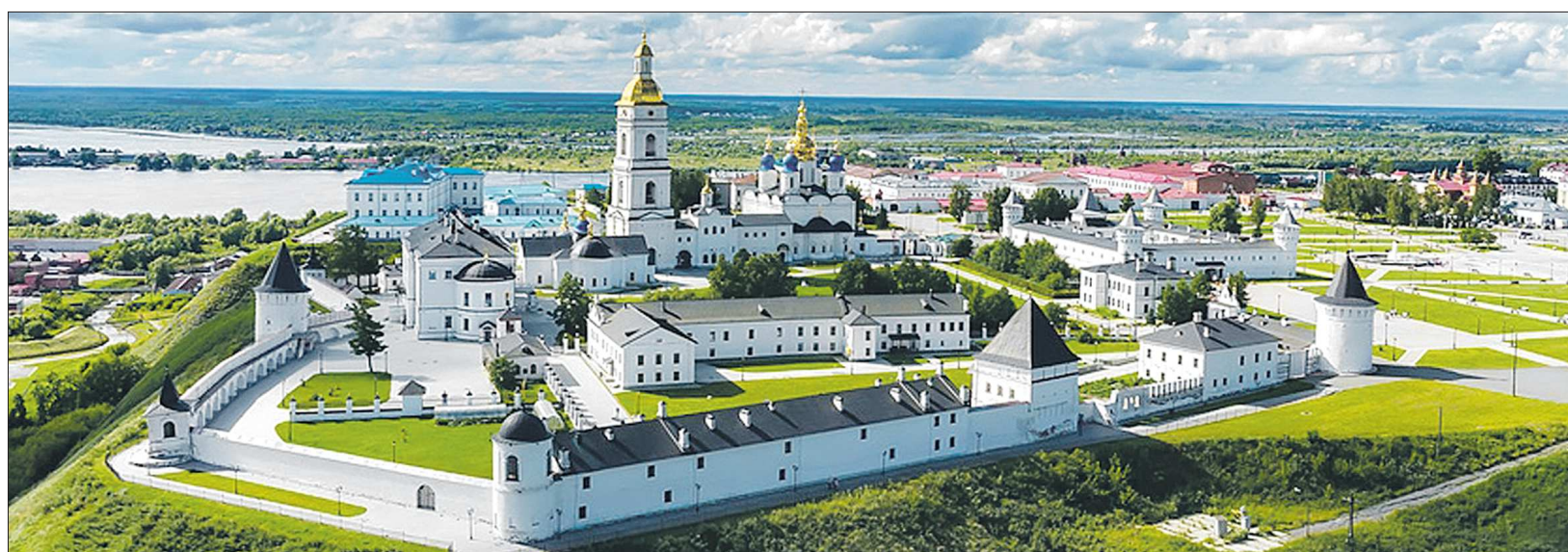
На территории Тобольского кремля расположились храмовый комплекс, Гостиный двор и 11 музеев

– К 2021 году в Тобольске решено построить свой аэропорт. Тогда турпоток должен значительно подрасти, – считает начальник отдела агентства туризма и продвижения Тюменской