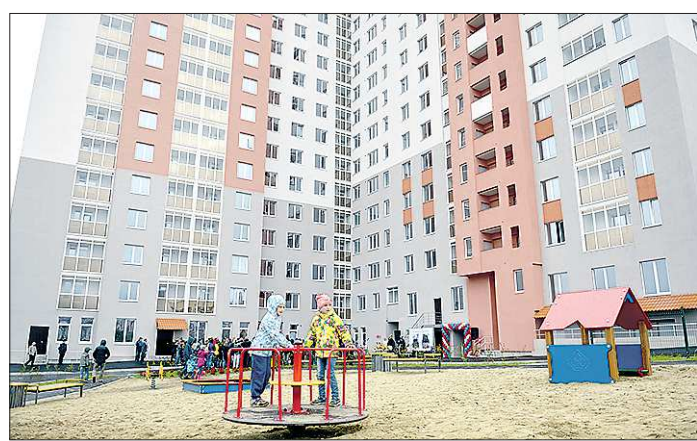
Во дворе жилого комплекса оборудована детская площадка, самые маленькие жильцы уже успели её опробовать