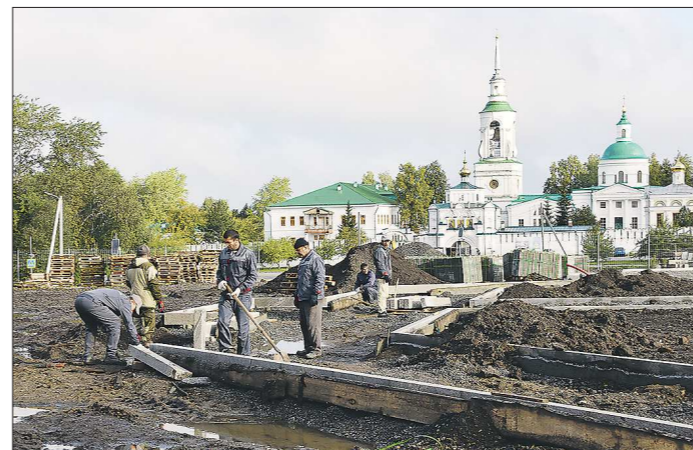
Реконструкцию площади ведёт компания из Екатеринбурга, к ноябрю первый этап работ должен завершиться

Самая большая и самая ожидаемая стройка Верхотурья - реконструкция главной площади. За четыре с лишним столетия она несколько раз меняла вид и назначение. В старину тут читали царские указы и рубили разбойничьи головы. В прошлом столетии площадь была то парком, то выложенной плиткой пустошью. Перед очередной перестройкой были учтены мнени-