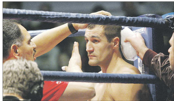
В 37 профессиональных боях у Ковалёва 33 победы, 3 поражения и одна ничья

До Олимпиады в Токио остаётся меньше года. В условиях максимально возросшей конкуренции нашим скалолазам нужно готовиться с удвоенной силой, разрабатывать специальные методики, чтобы первые медали Игр в скалолазании всё же достались нам.