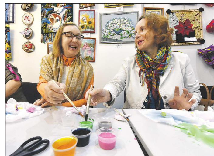
Во время месячника добрых дел пенсионеры смогут посетить самые разные творческие мероприятия и тематические лекции

Весь день возле ДИВСа будут проходить мастер-классы для пенсионеров по бисероплетению и росписи