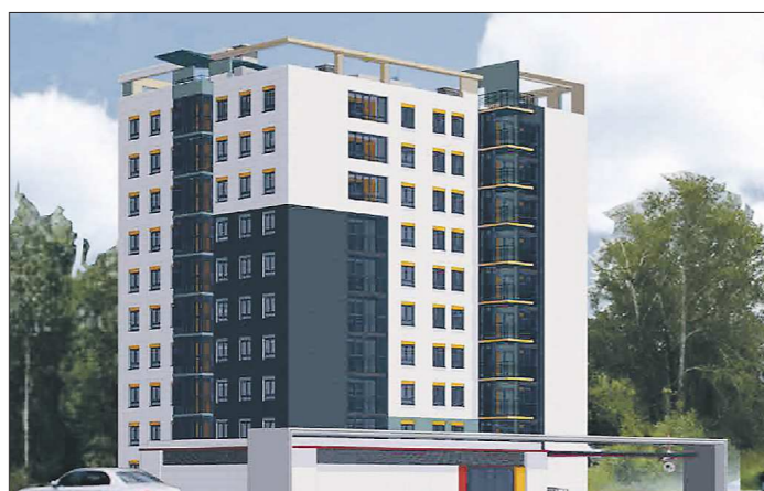
Так выглядит проект перестройки заводского общежития в Нижней Туре

Нижняя Тура начала реализовывать пилотный областной проект по созданию рынка арендных квартир для бюджетников и социально незащищённых граждан. Власть округа решила превратить комнаты бывшего заводского общежития в 42 благоустроенные квартиры, а для жителей старых бараков построить девятиэтажный дом.