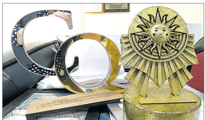
С международного циркового фестиваля в Испании девушка привезла, кроме серебряной награды, спецприз цирка «Дю Солей»

– После «Кубани» возвращение в «Урал» было связано с выходом команды в Премьер-лигу?