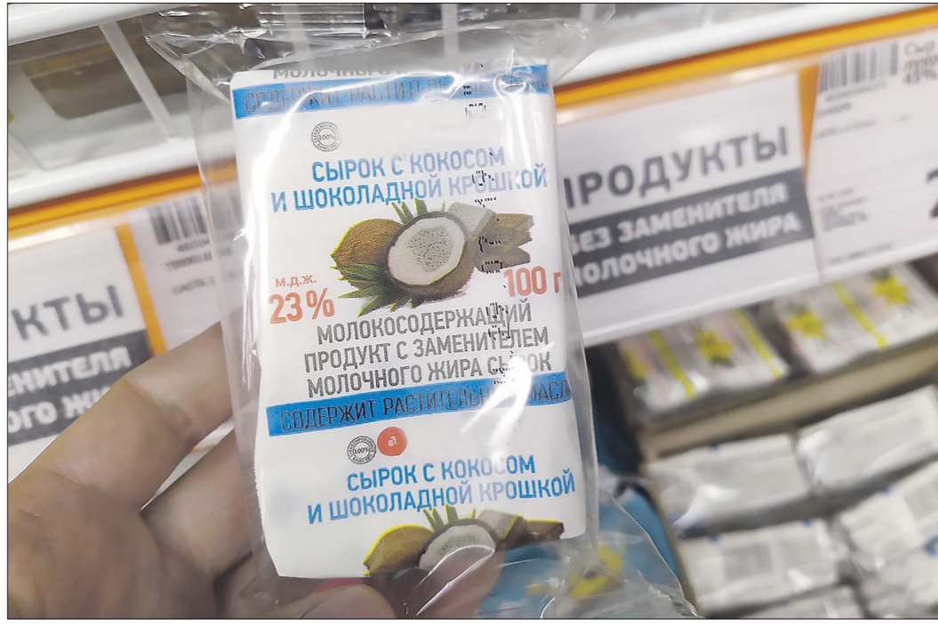
Зачастую на молочной полке под надписью «без заменителя молочного жира» можно найти продукты с растительными жирами

По сути, это – очередной этап борьбы с фальсификатом молочной продукции. Раньше многие производители скрывали, что для производства своих молоко-содержащих продуктов используют растительные жиры, прежде всего пальмовое масло, сегодня об этом пишут на упаковке. Но продаётся такой товар на одной полке с натуральной молочной, стоит дешевле, и люди вместо настоящего молока покупают это. Покупатель редко вчитывается в состав продукта. В результате производителем