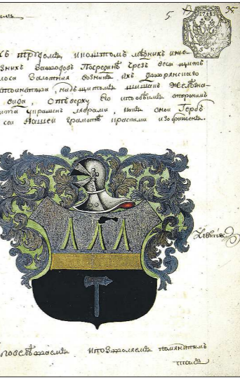
Уральские архивисты нашли в российских архивах один из первых вариантов родового герба Демидовых