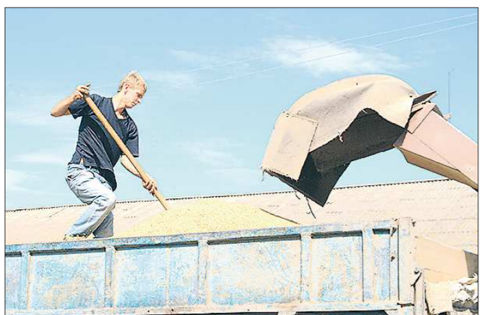
На селе есть дефицит кадров в сельскохозяйственных предприятиях