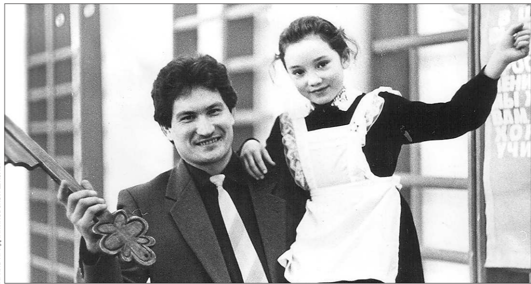
А директором Приданниковской школы нынешний министр стал в 1990 году, когда на заре вопроса о возведении для неё нового здания. Детей школьного возраста тогда было очень много – за парты сели ребята сытого и спокойного советского застоя. Да и потребность в учёбе даже в сельской местности стала намного выше, чем прежде: решено было Приданниковскую восьмилетку сделать школой среднего полного образования.