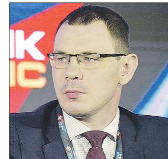
Егор Мехонцев – олимпийский чемпион Лондона-2012

Сразу три олимпийских чемпиона по боксу стали официальными лицами чемпионата мира, который пройдёт в сентябре в Екатеринбурге. Уроженец Асбеста Егор Мехонцев, а также уроженцы Омска и Новокуйбышевска Алексей Тищенко и Олег Саплов посетят открытые тренировки, будут присутствовать на официальных мероприятиях чемпионата.