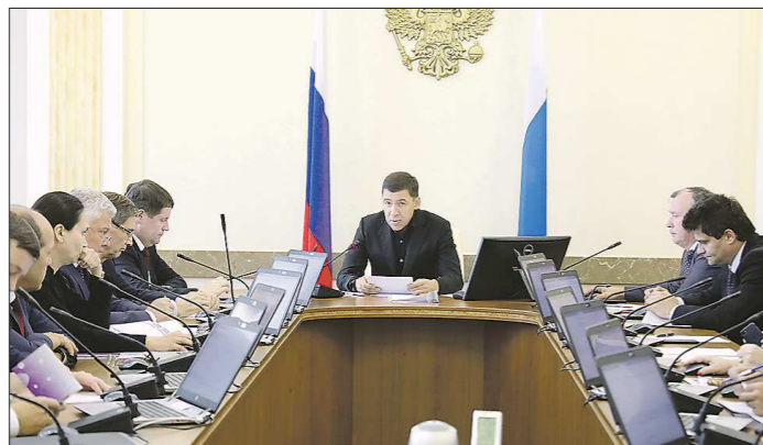
Правительство региона продолжает реализацию мер по улучшению качества жизни уральцев

Вчера правительство региона приняло ряд значимых постановлений, направленных на решение задач социально-экономического развития. Среди них - решение о компенсации затрат жителей муниципалитетов по платежам за услуги ЖКХ.