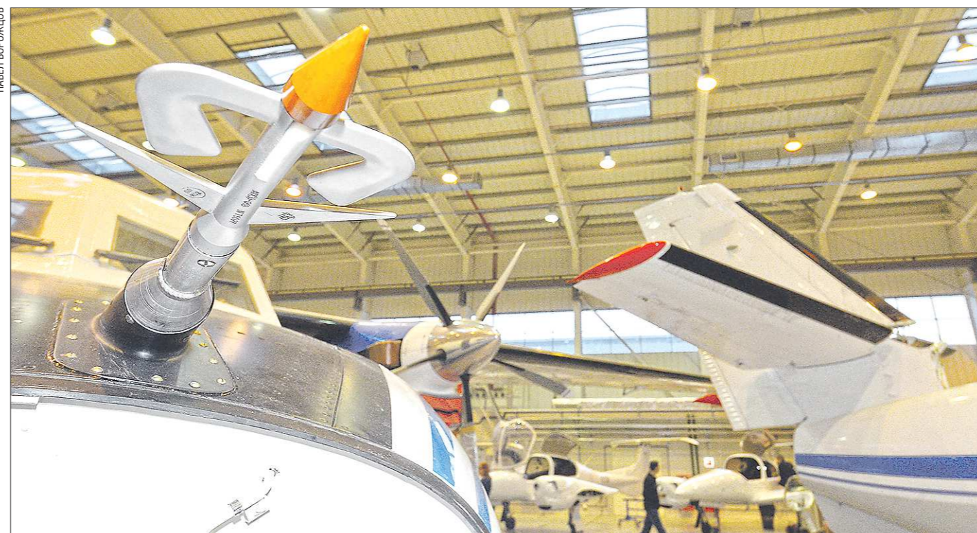
Один из показателей эффективности «Титановой долины» - наличие в регионе двух её площадок. Вторая очередь ОЭЗ - площадка «Укту» - была официально введена в прошлом году

Ассоциация кластеров и технопарков России по просьбе «Областной газеты» прокомментировала эффективность уральской ОЭЗ