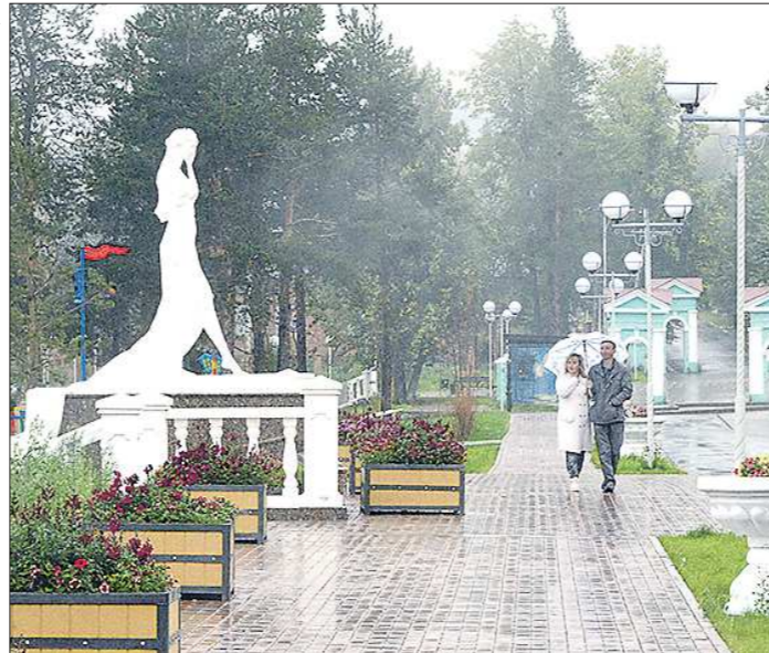
Скульптура девушки на городской набережной – символ реки Турья