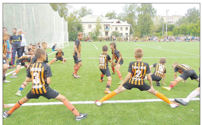
С сертификатами ждут теперь во дворцах культуры, центрах детского творчества и студиях. В спортивных и музыкальных школах, где реализуют программы предпрофессиональной подготовки детей, они не нужны

– Мы свою стратегию защитили ещё в 2016 году в Сколково перед российским вице-премьером Игорем Шуваловым. Она рассчитана до 2025 года, и 70 процентов того, что запланировали, уже сделали. Сейчас осталось построить новую школу в Заречном районе на 500 мест, мы называем её шуваловской. В правительстве области подтвердили, что проект школы включён в федеральную программу на 2020 год. Второй объект – детский сад на 280 мест в том же районе. Восстанавливаем здание бывшего садика, которое перешло в частные руки. Район густо заселён, детских садов не хватает, очередь детей – большая, хотя в целом по городу таких проблем нет. И третий проект – это физкультурно-оздоровительный комплекс с искусственным льдом. Будет строиться на деньги «Газпрома» без участия бюджета. Проект проходит государственную экспертизу, стоимость – порядка 350 миллионов рублей, в 2020 году планируем начать стройку. Много проектов по благоустройству общественных территорий – Тихомировский парк, Максимовский проспект. Начинаем второй этап благоустройства набережной. Кстати, наша набережная вошла в ТОП лучших практик России по благоустройству территорий.