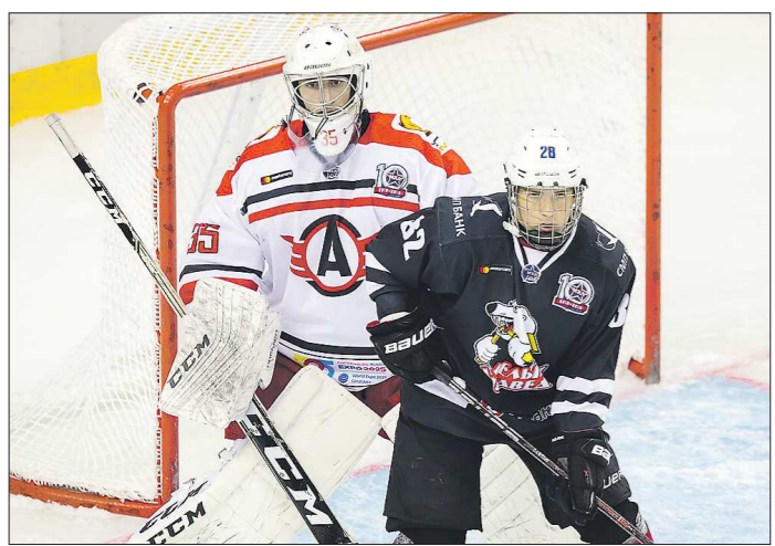
На предсезонном турнире в Уфе «Авто» пока не одержал ни одной победы