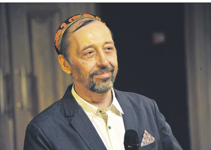
Один из самых самобытных театров региона – под руководством Николая Коляды, в 16-й раз открывает свои двери для зрителей

Традиционно первым в Екатеринбурге, 2 августа, открывает свой сезон «Коляда-театр». За первый месяц шестнадцатого театрального сезона будет показано 64 спектакля, а впереди – три осенние премьеры: «Калигула», «Детство» по Горькому и детский спектакль «Пузырь, соломинка и лапоть».