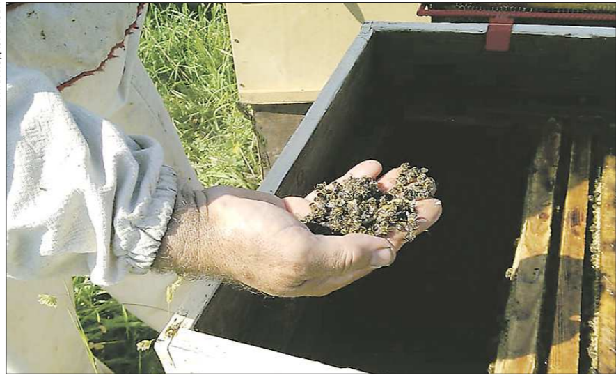
После мора ульи приходилось вычищать от мёртвых пчёл