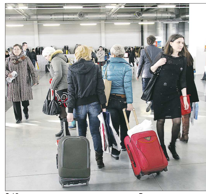
С 19 августа россияне не смогут везти в Россию более 5 килограммов фруктов

ИЗМЕНЯТСЯ ПРАВИЛА ПРОВОЗА В БАГАЖЕ ФРУКТОВ И ЦВЕТОВ ЧЕРЕЗ ГРАНИЦУ. Произойдёт это с 19 августа. Согласно новым