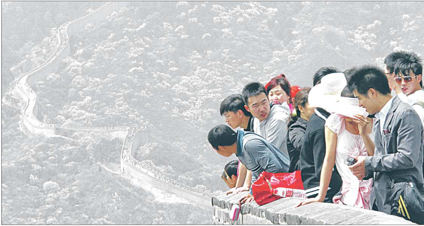
Не сосчитать тех, кто делает селфи на фоне Великой Китайской стены. Но вот взгляд со стороны: древняя стена и современные китайцы – да это же одно целое, продолжение, нация...