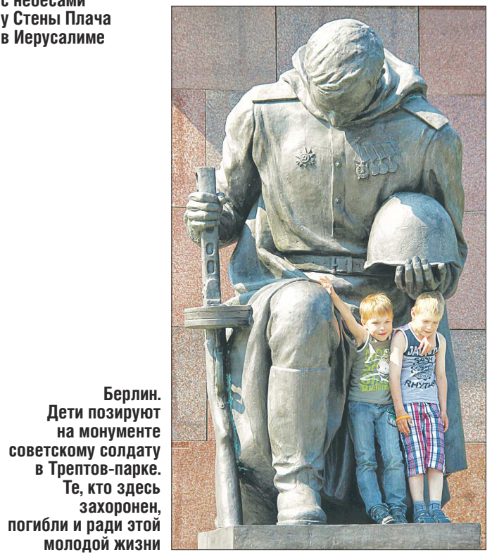
Берлин. Дети позируют на монументе советскому солдату в Трепов-парке. Те, кто здесь захоронен, погибли и ради этой молодой жизни