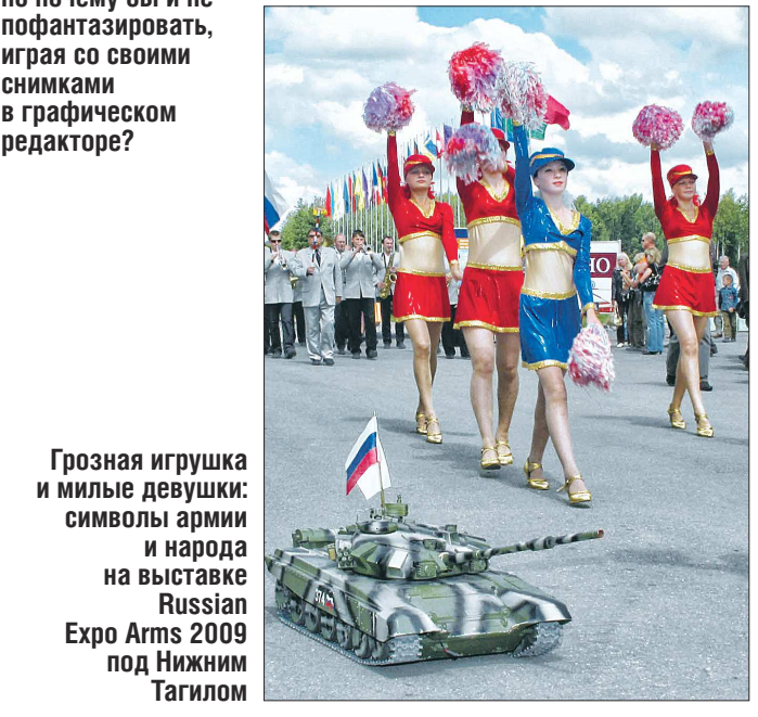
Грозная игрушка и милые девушки: символы армии и народа на выставке Russian Expo Arms 2009 под Нижним Тагилом