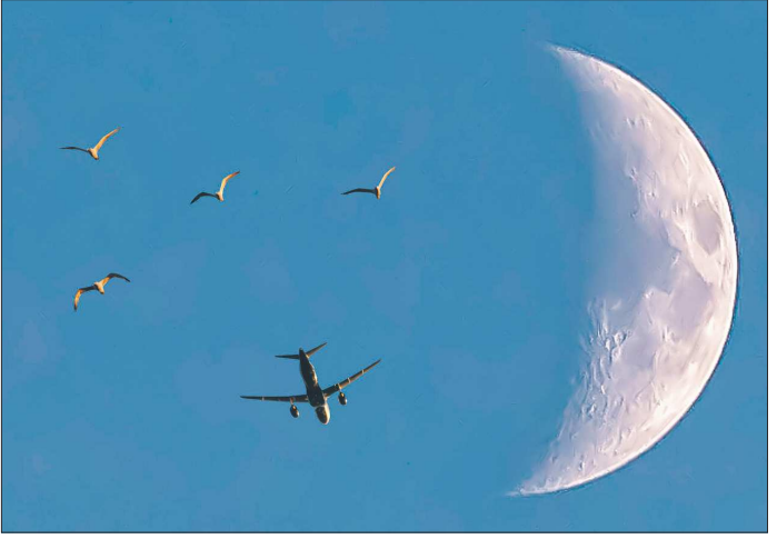
Да, это фотошоп – но почему бы и не пофантазировать, играя со своими снимками в графическом редакторе?