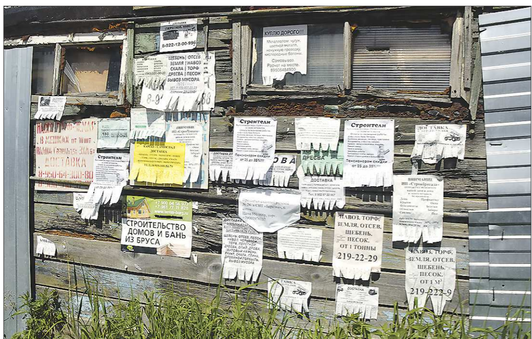
Основным способом распространения своих товаров и услуг для самозанятых является размещение объявлений – как бумажных, так и в интернете

Первого июля будет ровно полгода с начала эксперимента по введению налога на профессиональный доход (НПД) для самозанятых граждан в четырёх регионах России. По данным Федеральной налоговой службы (ФНС), на 1 июня в качестве самозанятых добровольно зарегистрировалось 106 тысяч человек, хотя на начало эксперимента их количество не превышало и трёх тысяч. Доход от их деятельности превысил 7 млрд рублей. «Областат» выяснила, как работает новый налог, что мотивирует граждан «выйти из сумрака» и стоит ли ждать расширения количества регионов участников в 2020 году?