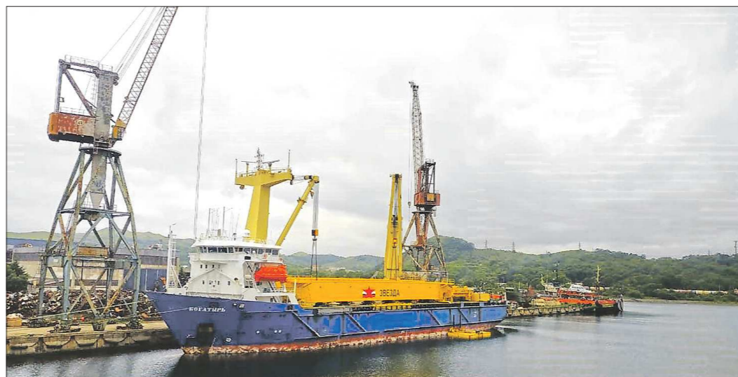
Уральские краны из Славянской бухты в порт назначения доставит сухогруз «Богатырь»

А суда со ступеней новой верфи ССК «Звезда» будут сходить востину богатырские. Ведь в Большом Камне строится первая в России верфь крупнотоннажного судостроения, способная удовлетворить потребности российских заказчиков в современной мощной морской технике для обеспечения добычи природных ресурсов на континентальном шельфе