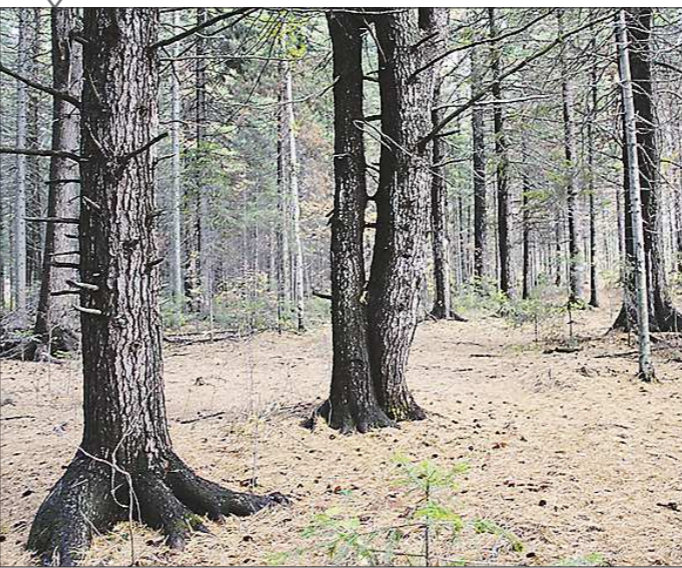
Кедровая роща в Нижней Салде уникальна - она единственная на Среднем Урале располагается в пределах города. Здесь растёт порядка 600 кедров возрастом от 60 до 350 лет. Любимое место отдыха жителей города очистят от сухостойных деревьев и благоустроят