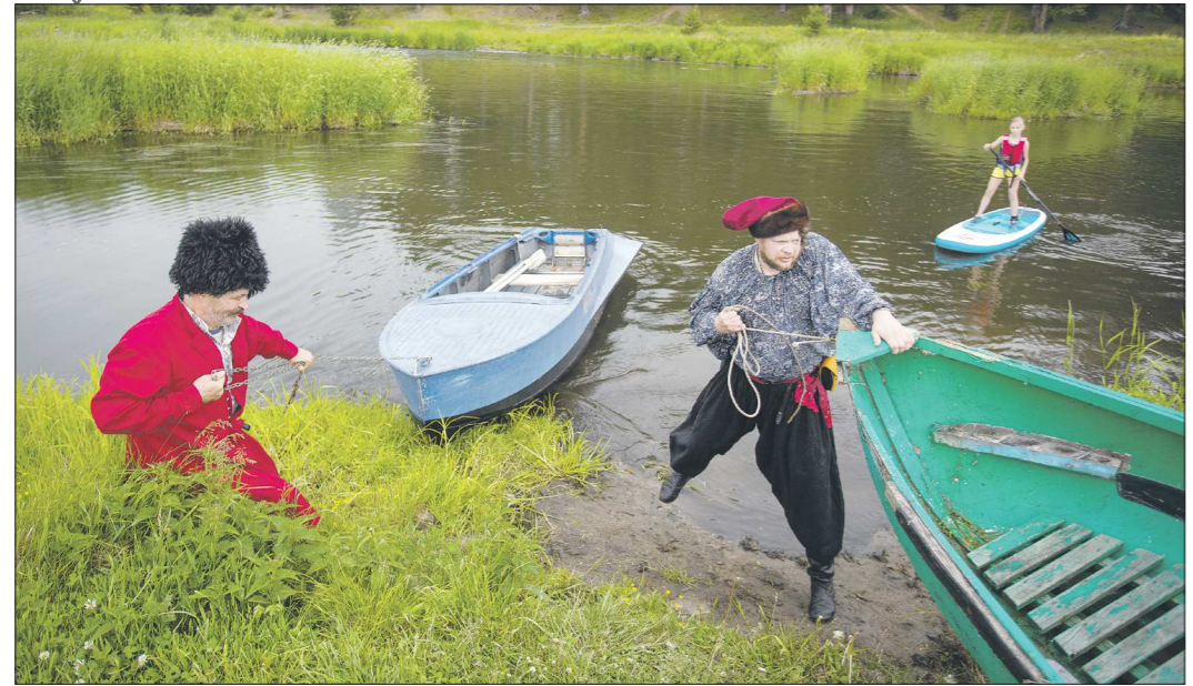
В минувшее воскресенье на Среднем Урале впервые прошёл областной фестиваль «День казачки». На праздник в посёлок Белоярский приехали около 500 человек из разных городов и районов Свердловской области — те, кто считает себя потомками казаков