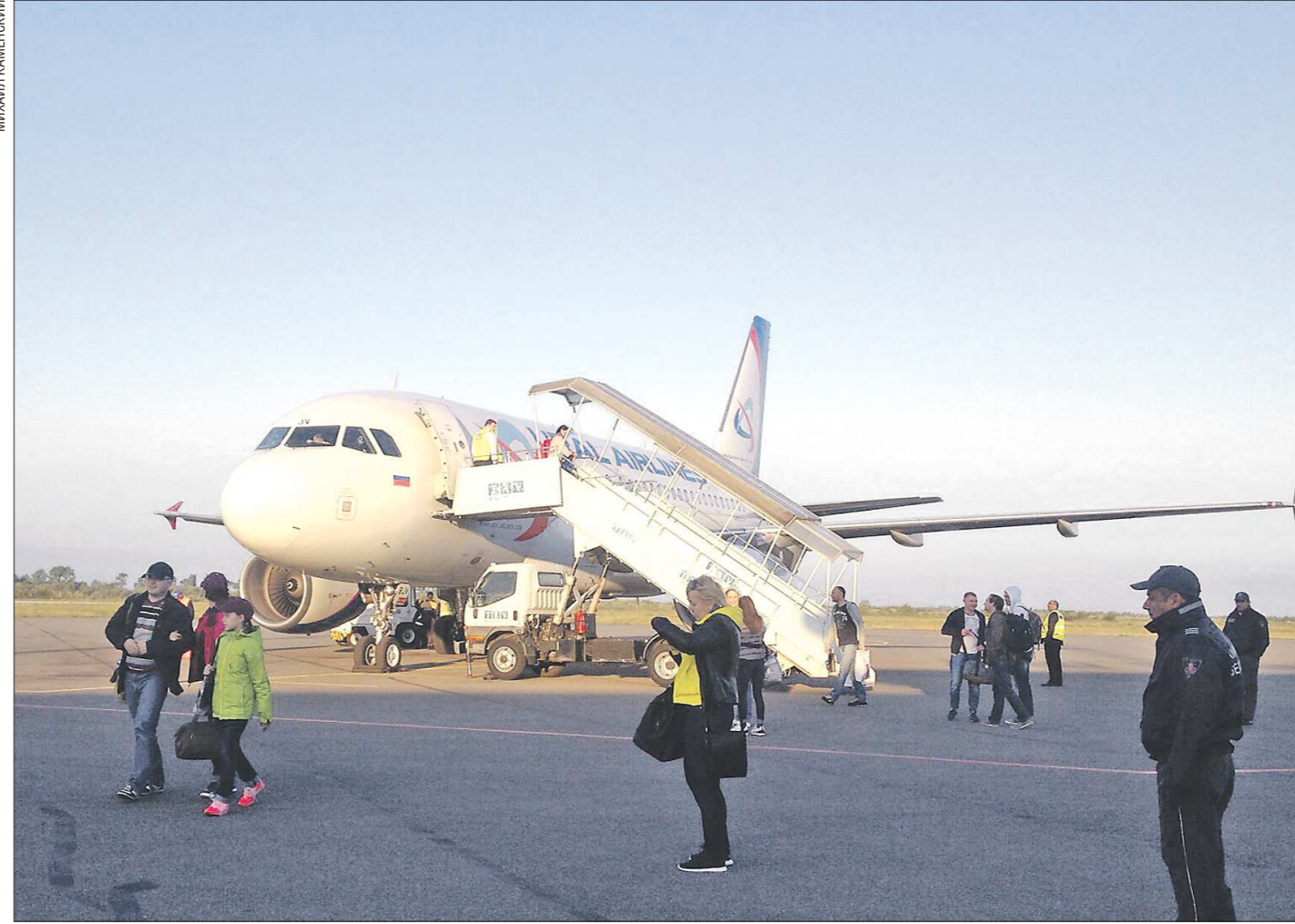
Прямые авиарейсы из Екатеринбурга в аэропорт Батуми (на фото) пользовались немалым спросом у уральцев - только официально сейчас отдыхают в Грузии около 3 000 жителей региона

После того, как Владимир Путин подписал указ о запрете воздушных пассажирских перевозок из РФ в Грузию, авиакомпания «Уральские авиалинии» закрыла продажу билетов в Грузию и аннулировала все билеты на свои рейсы в Батуми, Кутаиси и Тбилиси после 8 июля. Пассажирам возвращают полную стоимость билетов. Всех, кто уже улетел в Грузию, авиакомпания вернёт домой. Так же поступают и другие перевозчики