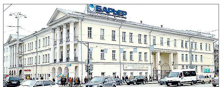
Управление горных заводов просуществовало в здании на Ленина, 26 с момента основания до советского времени