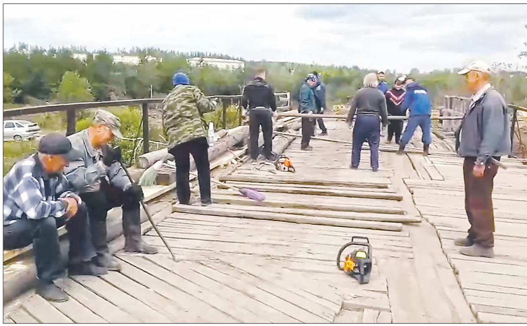
Свою народную стройку серовчане в шутку называют «уральским БАМом»: работали дружно и с огоньком

Наверное, так и ездили бы тихоно по этому мосту до следующего «народно-