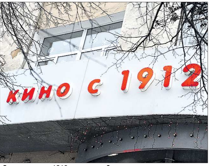
«Салют»: кино с 1912 года и по...?