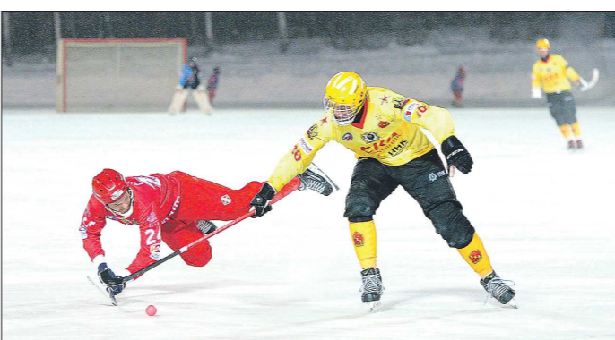
Утверждение, что игрок одной из команд нарушил правила, при желании тоже можно квалифицировать как «негативное высказывание об участнике чемпионата»?

Федерация хоккея с мячом России напомнила о своём существовании, но лучше бы она этого не делала. Хоккей с мячом не относится к числу тех видов спорта, о которых часто пишет пресса.