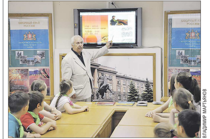
Краеведческие книги о Свердловской области, написанные сразу на двух языках, очень мало. К 70-летию установления дипломатических отношений между Россией и КНР в Екатеринбурге вышло издание-биллинг «Урал-Китай: прошлое, настоящее, будущее», посвящённое дружбе Поднебесной и опорного края державы.