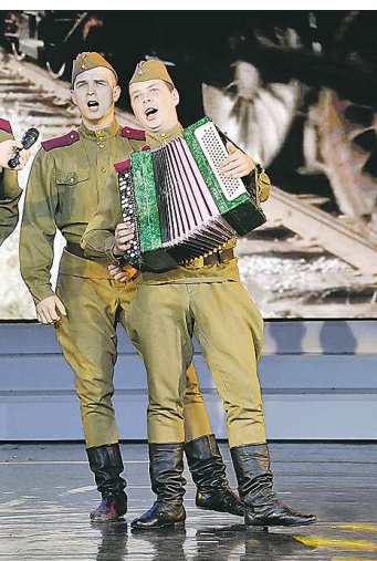
«Гармошка фронтовая» (ансамбль Северо-Западного округа)

ский округ) – оперная певица, работавшая в театрах Екатеринбург и Челябинска, лауреат многих международных конкурсов и фестивалей. Так что неправильно проводить параллели с популярным некогда советским конкурсом армейской и флотской самодеятельности «Когда поют солдаты». Здесь поют и танцуют профессиональные артисты – для сотрудников Росгвардии. Выступают в войсках, в том числе в горячих точках, поднимают боевой дух.