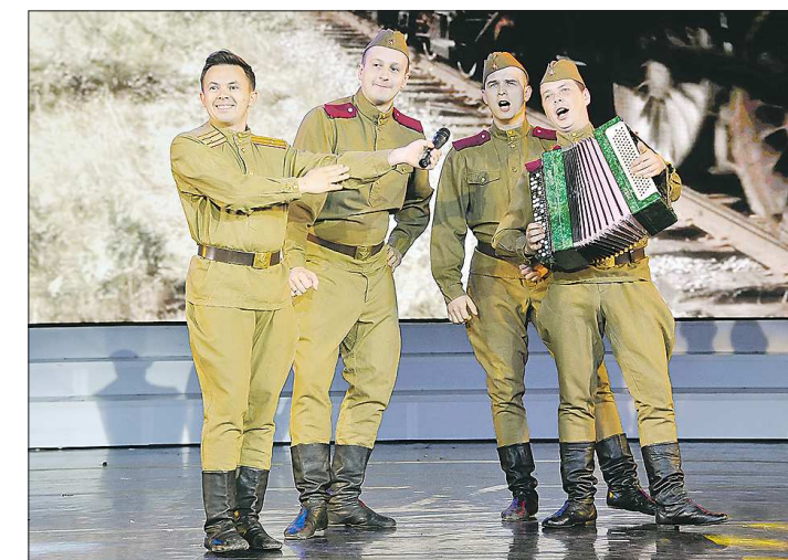
«Гармошка фронтовая» (ансамбль Северо-Западного округа)