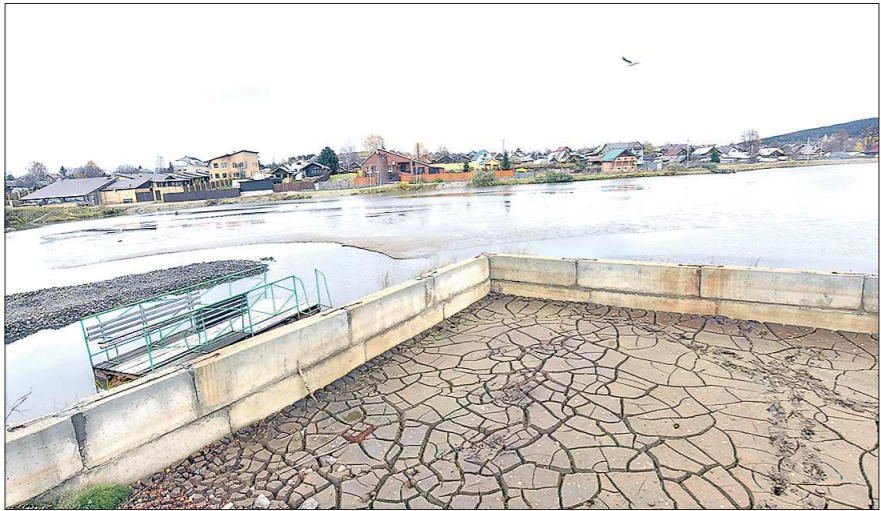
Так выглядит шламонакопитель Черноисточинского гидроузла. В нём хранили отходы после очистки питьевой воды

Пришлось срочно взяться за очистку Черноисточинского пруда от стоков. В декабре того же года утвердили комплексный план по реабилитации пруда и внесли изменения в региональную госпрограмму «Обеспечение рационального и безопасного природопользования на территории Свердловской области до 2024 года». На реабилитацию водоема выделены более 300 миллионов рублей. Сумма пока неокончательная, потому что проект экологической реабилитации пруда и прибрежной полосы ещё не утверждён Федеральным агентством водных ресурсов. По словам заместителя министра природных ресурсов и экологии Свердловской области Вячеслава Тюменцева, это случится в ближайшее время. Основные работы запланированы на 2020–2022 годы.