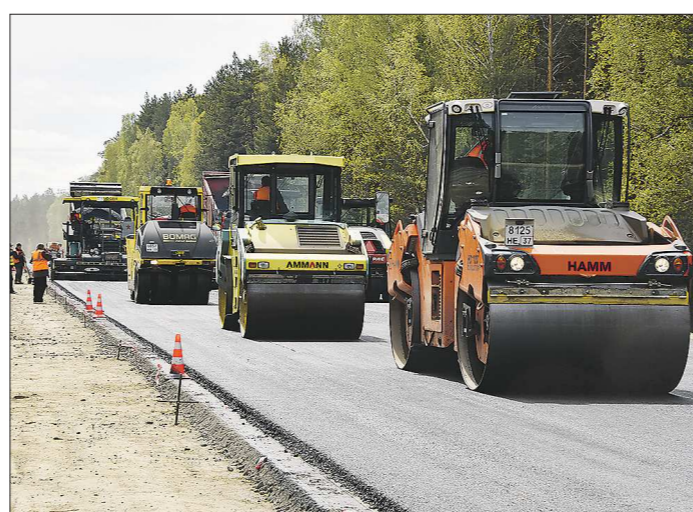
Требования к составу асфальтобетона повышены до европейского уровня и адаптированы к сложным уральским погодным условиям

В ходе ремонта дорог будут применяться специаль-