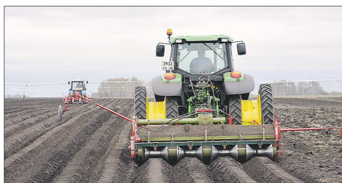
В эти дни в разгаре посадка картофеля, специальная техника нарезает для этого гребни

Старт посевной кампании был дан в конце апреля, сейчас полевые работы идут по плану, к началу июня сев должен завершиться. Посевные площади региона в этом году выросли на 2,5 тысячи гектаров – до 773 тысяч. Больше посеяно трав, зерновых и зернобобовых культур, чтобы полностью обеспечить нужды уральского животноводства.