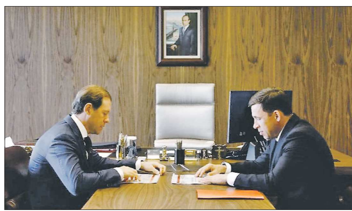
Денис Мантуров (слева) отметил особую важность предстоящих международных мероприятий, а также подчеркнул необходимость дальнейшей детальной проработки их повестки