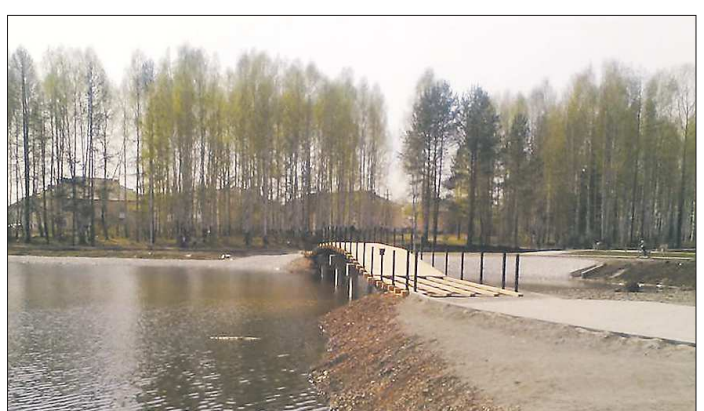
В ходе благоустройства Комсомольского парка в Волчанске был установлен мост, сейчас на нём работы продолжаются

Сейчас в «Титановой долине» в Верхней Салде – 11