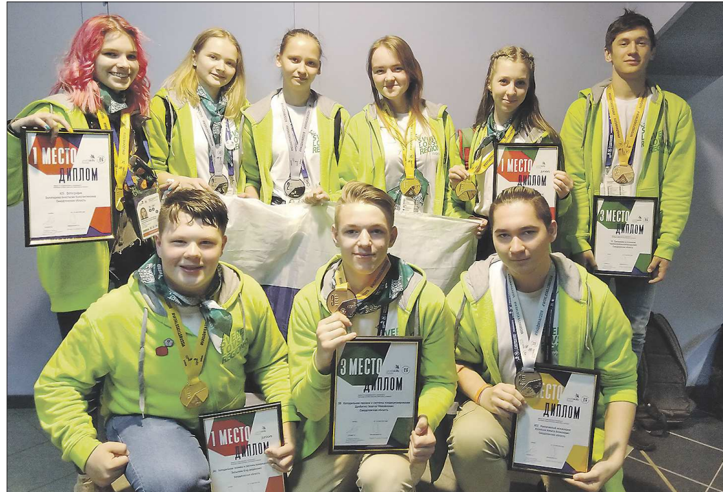
Медалисты WorldSkills Russia-2019 от региональной команды Свердловской области будут рекомендованы в расширенный состав сборной России WorldSkills

– У меня было задание собрать рекламную витрину на тему «Утешества» и представить на ней товар, которым являлись разные виды чемоданов. В первый день я готовила режиссер и моделировала эскиз будущей витрины на компьютере. Во второй и третий дни я занималась сборкой, оформлением и покраской уже готового продукта. Было очень слож-