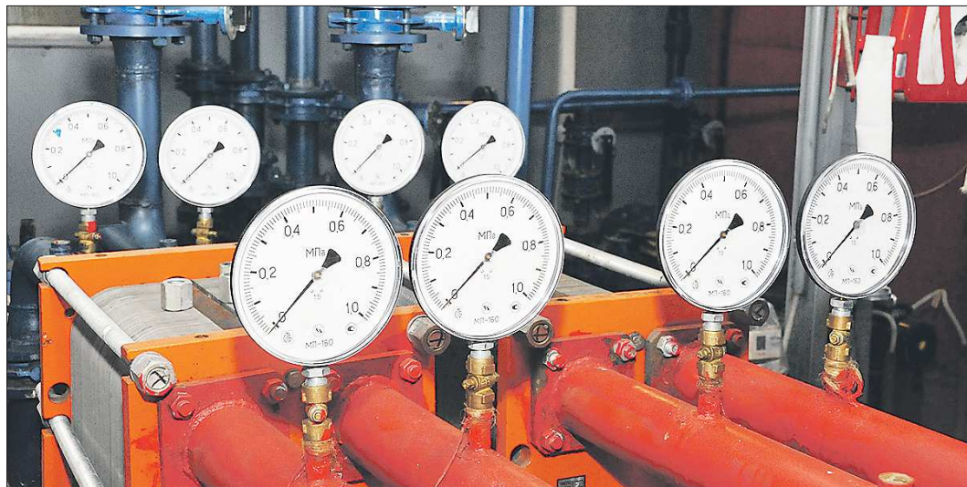
Энергосистема области во время отопительного сезона прошла максимум нагрузку в штатном режиме

Общая сумма работ в рамках нацпроекта составляет 3,6 миллиарда рублей. 95 процентов выделяются из федерального бюджета.