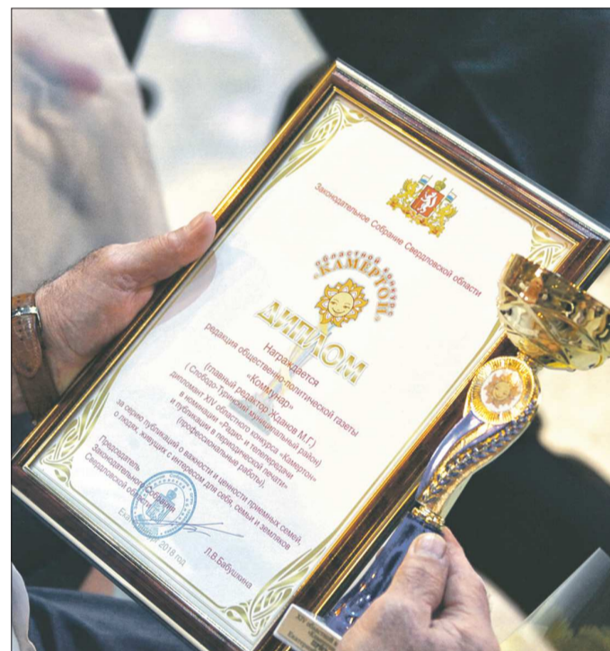
Такие награды получали участники «Камертона»

Каждый год для конкурса выбирается тема, кото-