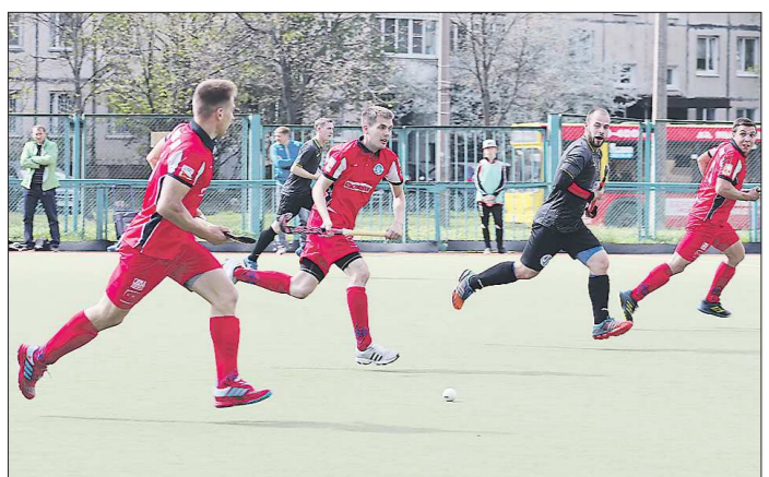
Когда в 2002 году екатеринбургское «Динамо» завоевало последние на сегодня золотые медали, некоторые нынешние игроки команды едва появились на свет