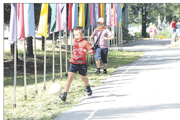
В Екатеринбурге этим летом дети смогут отдохнуть более чем в 100 лагерях дневного пребывания

Основная задача перед началом летней оздорови-