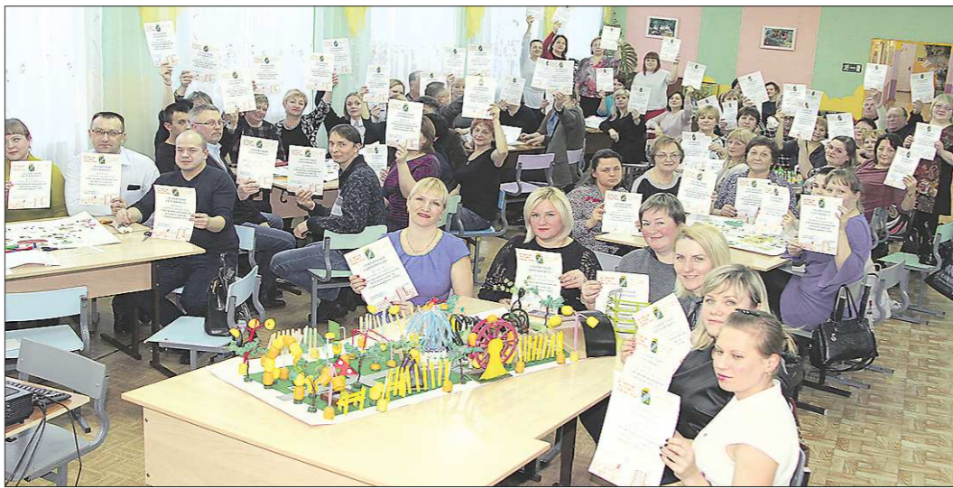
В Бисерти будущий сквера обсуждали в формате деловой игры: лучшие предложения вошли в проект, получивший в итоге победу

Кроме вышеуказанных муниципалитетов, за федеральные гранты на благоустройство нынче боролись Богданович, Верхняя Пышма, Камышлов, Нижняя Салда, Новоуральск, Сысерть, Туринск, Верхние Серги. Все они успешно выдержали «экзамен» на региональном уровне и прошли первый этап всероссийского конкурса – техническую экспертизу. Но во время второго этапа – эксперт-